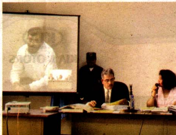
PROCESO. Los sindicatos de la narcomatanza fueron los primeros en rendir declaración por medio de videoconferencias.

El sistema de juicio virtual se aplicará a cualquier tipo de audiencias que establezca el procedimiento penal.