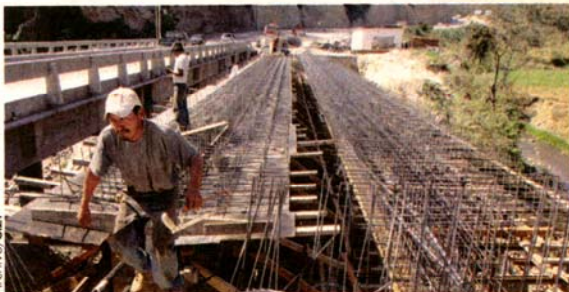
INVERSIÓN. Comunicaciones desembolsará Q17.5 millones en una supervisora extra para las obras de reconstrucción.

Ana Lucía Mendizábal, Siglo 21 amendizabal@sigloxxi.com