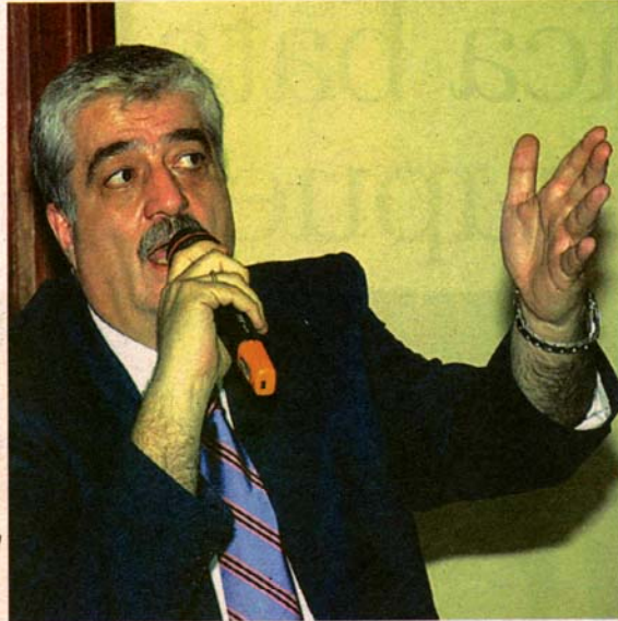
EN PRISIÓN. El ex ministro de Gobernación Carlos Vielmann permanece en una cárcel española desde el 13 de octubre.

Resolución de la CC pone en apuros a la Fiscalía al suspender la solicitud a España para extraditar al ex ministro Carlos Vielmann.