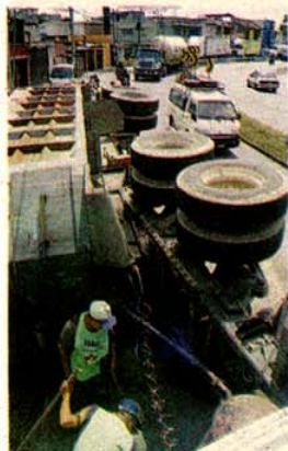
Un camión que transportaba arena, volcó en el Anillo Periférico, zona 2.