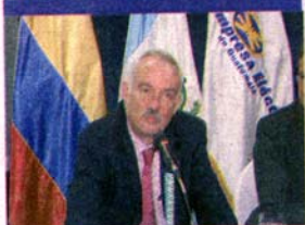
Las nuevas autoridades de la EEGSA empiezan a tomar las riendas de la empresa.

Miembros del Sindicato Nacional de Trabajadores de Salud, informaron que el día de mañana, miércoles 24 de noviembre, realizarán un plantón frente a las instalaciones del Ministerio de Salud para presionar al Congreso en la aprobación del presupuesto de Q600 millones a esa cartera y en exigencia del cumplimiento del pacto colectivo por parte del ministro Ludwig Ovalle. De la misma forma, bloquearán ocho puntos en toda la República: fronteras Tecún Umán, El Carmen, Cruce las Victorias, El Boquerón, El Rancho, Nahualate, San Julián y el Aeropuerto Santa Elena en Petén.