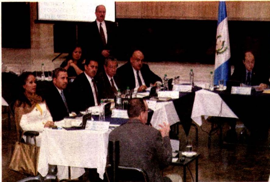
LOS COMISIONADOS de la Postuladora a Fiscal General continuaban hoy escuchando los planes de trabajo de los aspirantes. La mayoría no incluyó a la CICIG dentro de su proyecto.

La CICIG apunta, además, que el 65 por ciento de los candidatos no toman en cuenta la utilización de métodos especializados de investigación, los cuales podrían "llevar a un nivel idóneo las investigaciones contra el crimen organizado