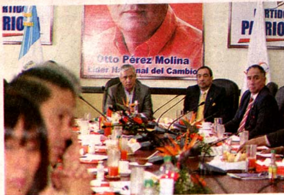
La bancada Patriota se reunió con autoridades del partido para evaluar sus decisiones en torno a la Ley de Extinción de Dominio.

Los representantes en esa sala del bloque Partido Patriota no habían firmado a la espera de esta reunión;